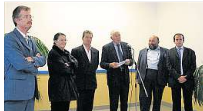
Mardi soir dans les locaux de la Source, René Benoit, maire, avait réuni toutes les équipes pédagogiques des écoles privées et publiques, la commission des affaires scolaires, l'inspection académique, les représentants de l'éducation nationale au conseil des écoles ainsi que les représentants de parents d'élèves. L'occasion de brosser le tableau des départs et des arrivées chez les enseignants et surtout de resserrer les liens entre tous les acteurs de la vie scolaire.